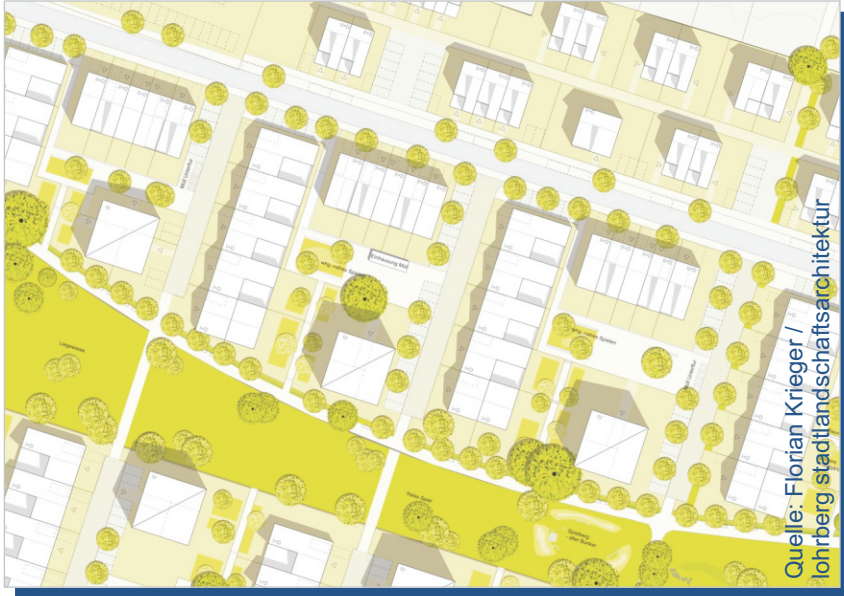
Auszug Städtebaulicher Entwurf